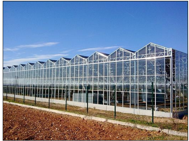
fig. 13 - serra fotovoltaica