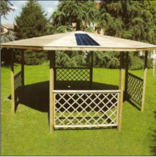
fig. 10 - applicazione su gazebo