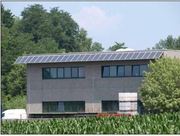
fig. 16 - frangisole collegato in rete, Besana in Brianza