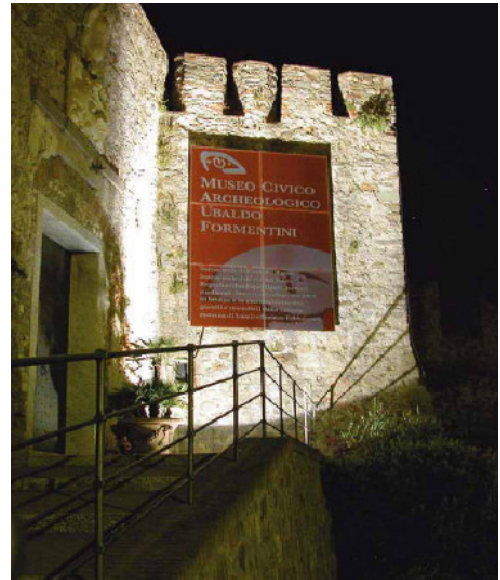
fig. 7 - funzionalità informativa ed estetica/valorizzativa