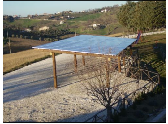
fig. 11 - parcheggio fotovoltaico (www.colleregnano.it)