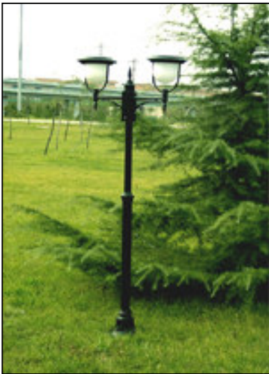
fig. 12 - lampione solare