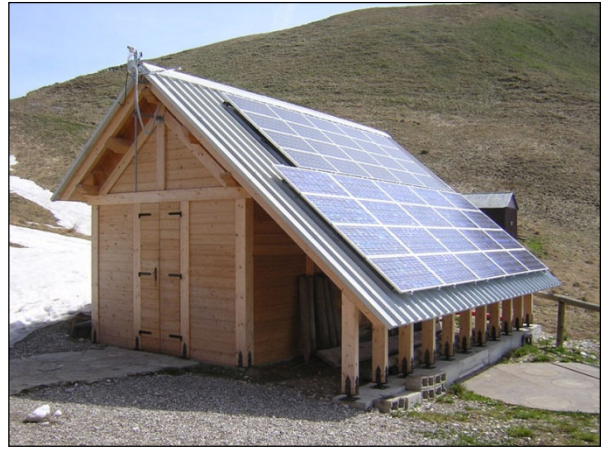
fig. 17 - impianto stand alone ( www.dolomitipark.it )