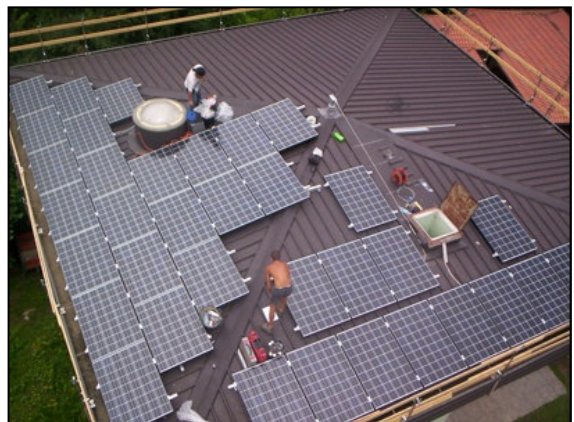
fig. 14 e 15 - barche elettriche e realizzazione in Sede - Ente Parchi Lago Maggiore (www.parchilagomaggiore.it)