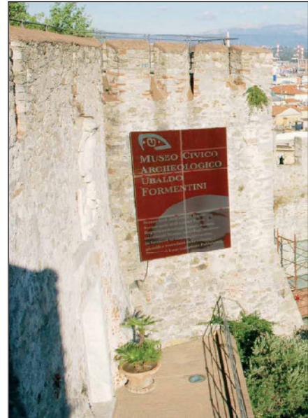
fig. 5

Dove sono i moduli fotovoltaici? Nel primo caso essi "sono" parte costituente, insieme alla struttura in legno, della copertura; nel secondo essi compongono il cartellone turistico informativo appeso sulla parete della torre.