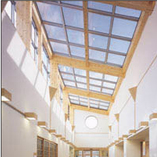
fig. 4 - www.suntech-power.com