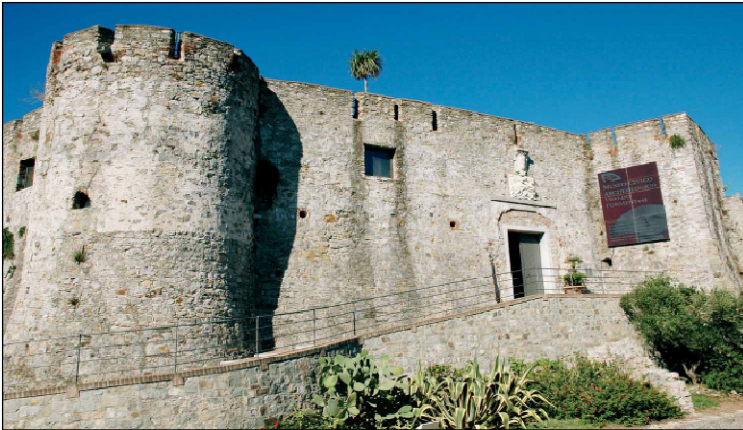
fig. 6 - impatto visivo sulle mura del castello