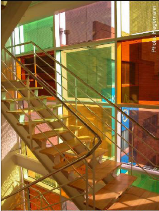
fig. 3

Un ulteriore miglioramento è stato quello di poter colorare i moduli al fine di renderli componenti estetici attivi del design dell'edificio.