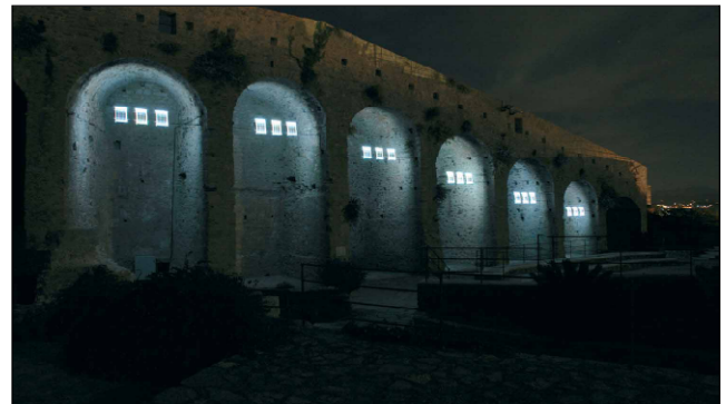
fig. 8 e 9 - impatto visivo sulle mura del castello e relativo sistema autoilluminante notturno